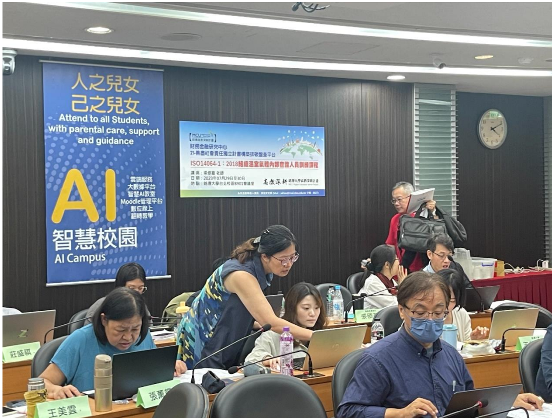
照片 3 及 4: 112/7/29-30 辦理辦理碳排放教育訓練上課內容 1 及 2