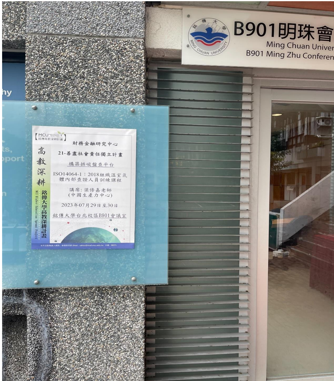
照片 2: 112/7/29-30 辦理辦理碳排放教育訓練海報