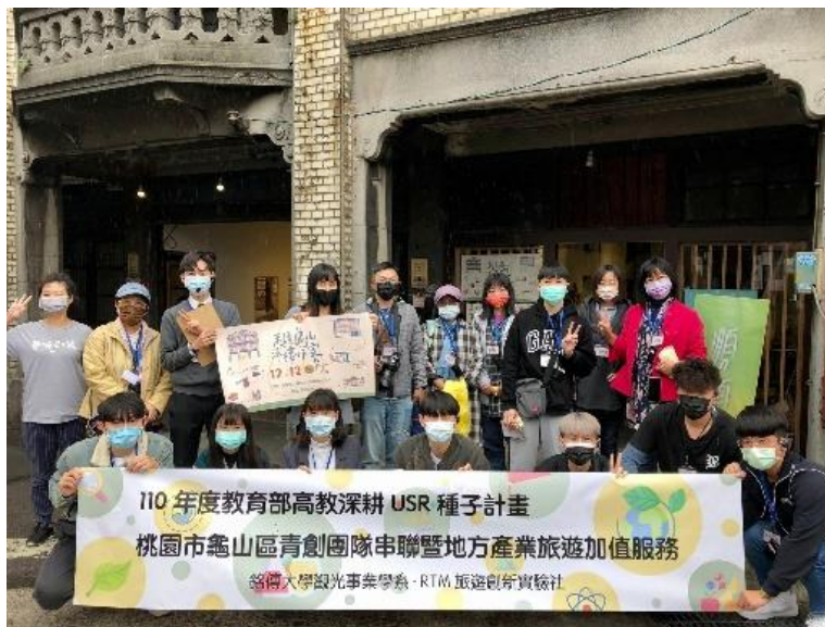
■ 《撥開黑色迷霧：龜山三德礦業所歷史空間 再現》發表會活動