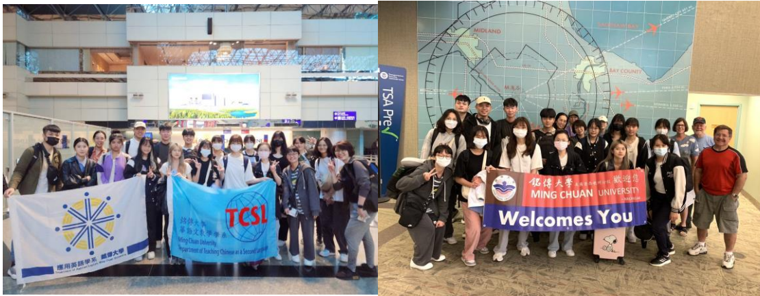
美國分校移地教學團展開海外研習與華語教學